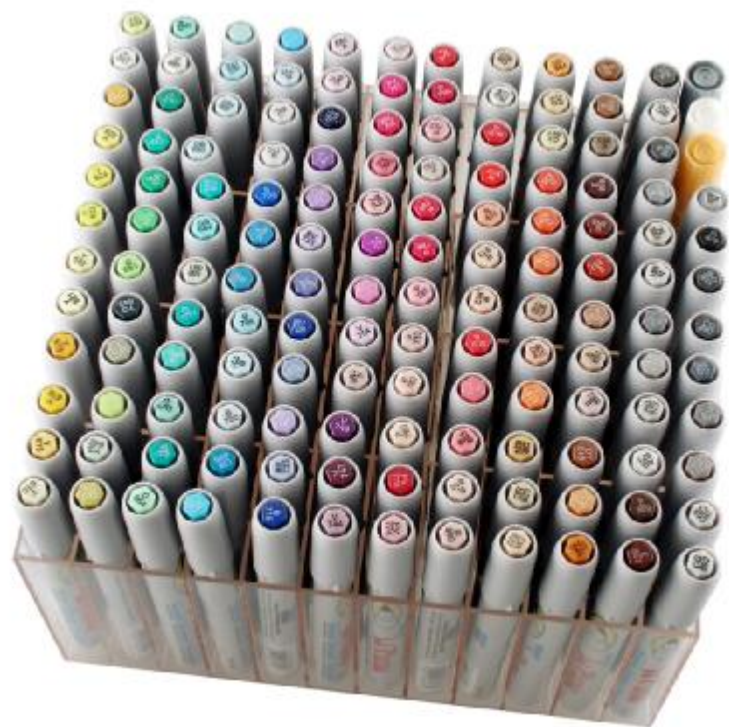
Дисплеи для магазинов